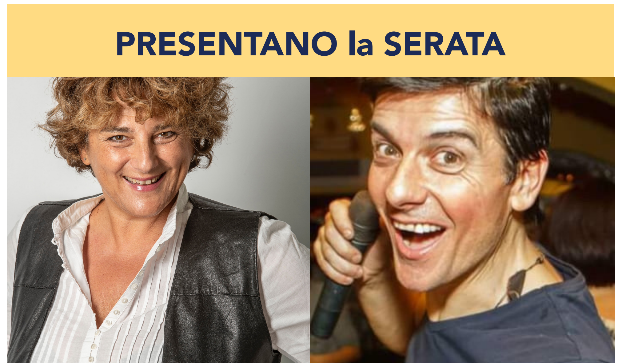
VIVIANA PORRO da Zelig